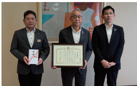
写真撮影時のみ、マスクを外していただきました

また、こちらの定期預金は、SDGsの目標のひとつでもある「3. すべての人に健康と福祉を」にも通ずる性質を持った商品でもあります。これからも、当組合の理念でもある「共存共栄」の精神を胸に抱きながら、組合員様ならびに社会全体に少しでも貢献できるような取り組みを行なっていく所存でございます。どうぞ、今後とも愛知商銀をよろしく願います。