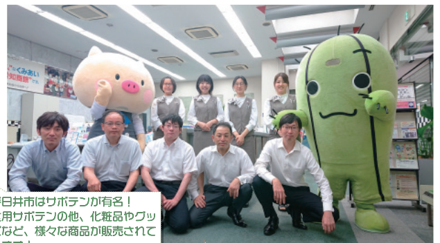
春日井市はサボテンが有名！ 食用サボテンの他、化粧品やグッズなど、様々な商品が販売されています！